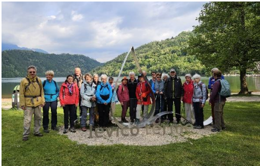
(A-Gruppe am Levicosee)

Am Donnerstag wanderte die A-Gruppe erneut auf dem Fischerweg,