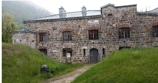
(Forte delle Benne)