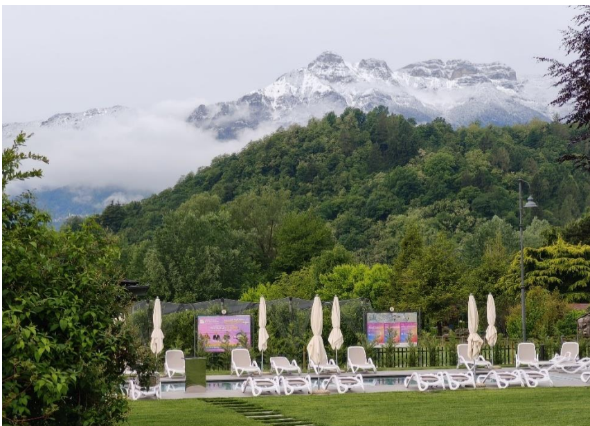
(Pool am Hotel und im Hintergrund die schneebedeckten Berge)

Trotz schlechter Wetterprognosen –in der Nacht hatte es merklich abgekühlt und